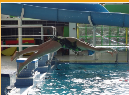
Les nageurs de la section